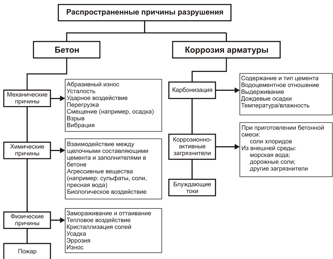
Рисунок 1 – Распространенные причины разрушений конструкций

Примечание – Дополнительная информация о воздействии проектных и строительных ошибок на долговечность сооружения приведена в А.4.3 приложения А.