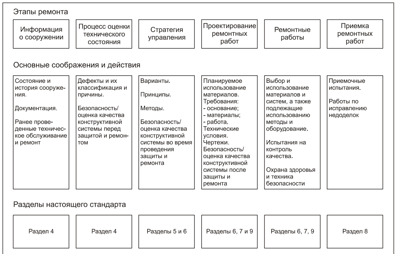
Рисунок А.1 – Пример этапов стандартного проекта по ремонту